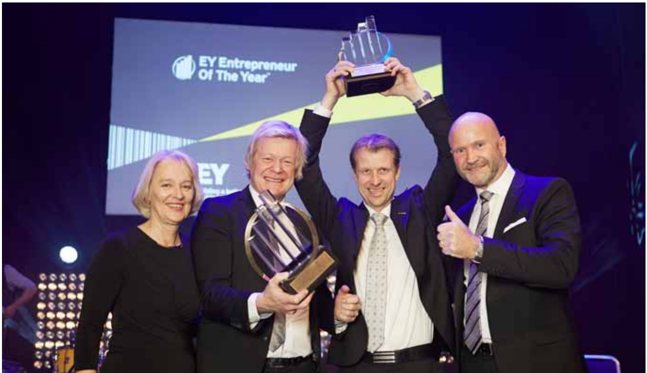
Betonmast Entrepreneur of the year