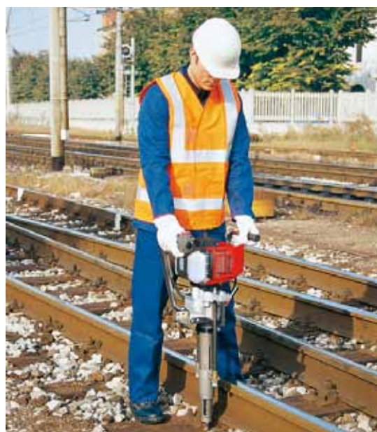
Melbye Skandinavia - Jernbanemateriell