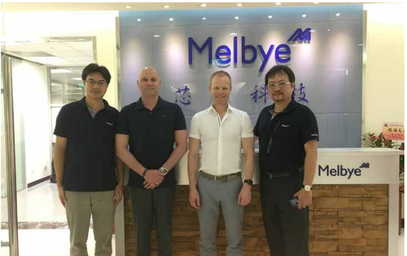
Melbye Skandinavia - Taiwan

Vi arbeider videre med planer om å utvikle den innerste delen av bassenget til boliger og næringsarealer.