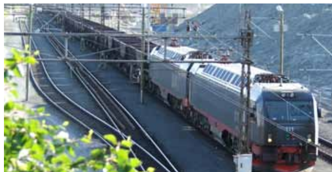
Melbye Skandinavia - system for bane