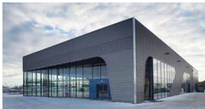
Betonmast Romerike - Sulland