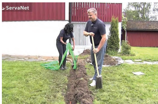
Fiber to the home