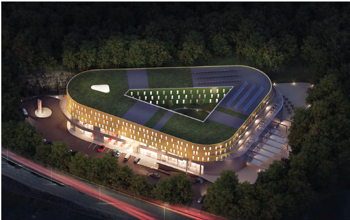
Betonmast - Scandic Flesland Hotell

Vi har stor fokus på produktutvikling innenfor våre kjerneområder, både for å øke konkurransekraften og for å kunne tilby våre kunder smartere løsninger. Det er fortsatt fokus på vekst.