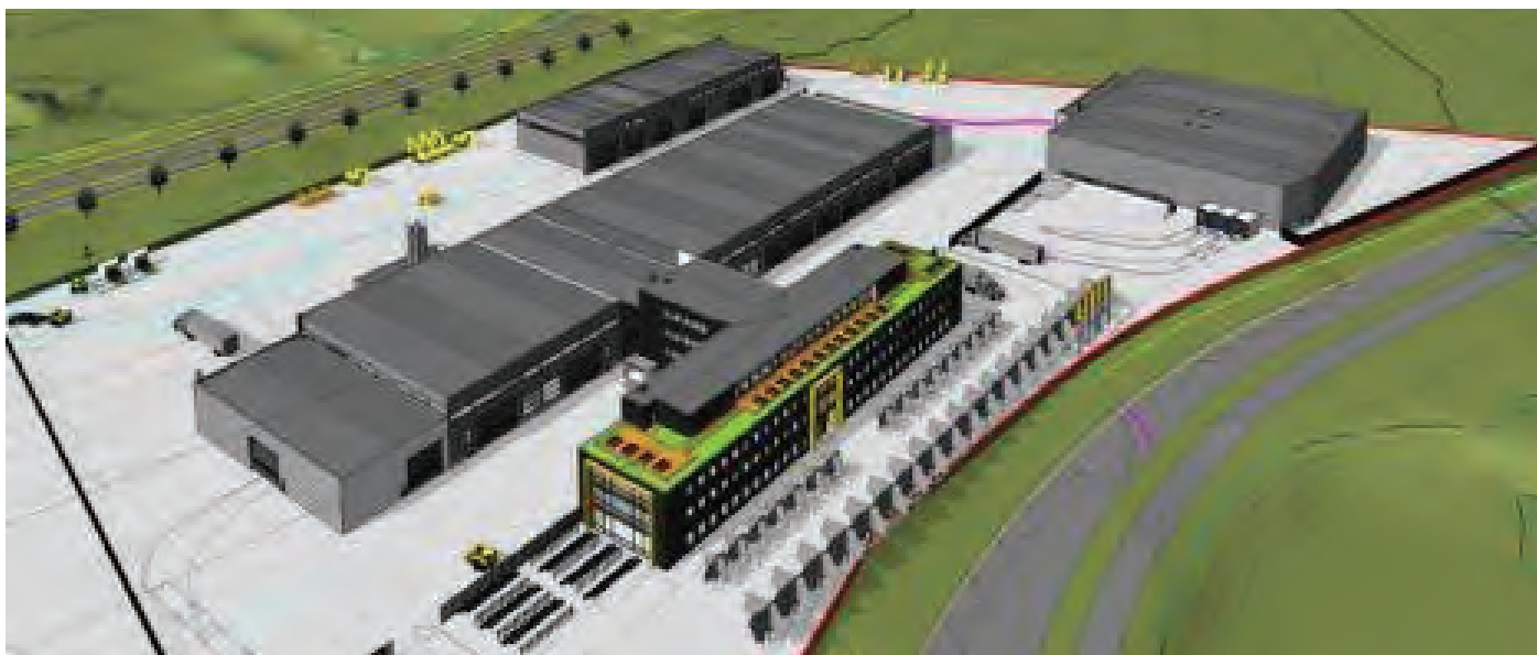
Betonmast - nytt hovedkvarter for Pon-Cat

Den nye forretningsmodellen for virksomheten i Danmark gir gode resultater både i salg og lønnsomhet. I Norge har vi meget god utvikling på Energisektoren og vi vokser mer enn total markedet, mens volumene på Telecom og Kanalisasjon ikke når våre målsettinger. Totalomsetningen ble MNOK 216 som er en vekst på 11 % . Virksomhetene i Norge, Sverige og Danmark oppnådde salg på MNOK 357. I forhold til 2013 er dette en imponerende vekst på nesten 20 %. Vår oppfatning er at vi øker vår markedsandel.