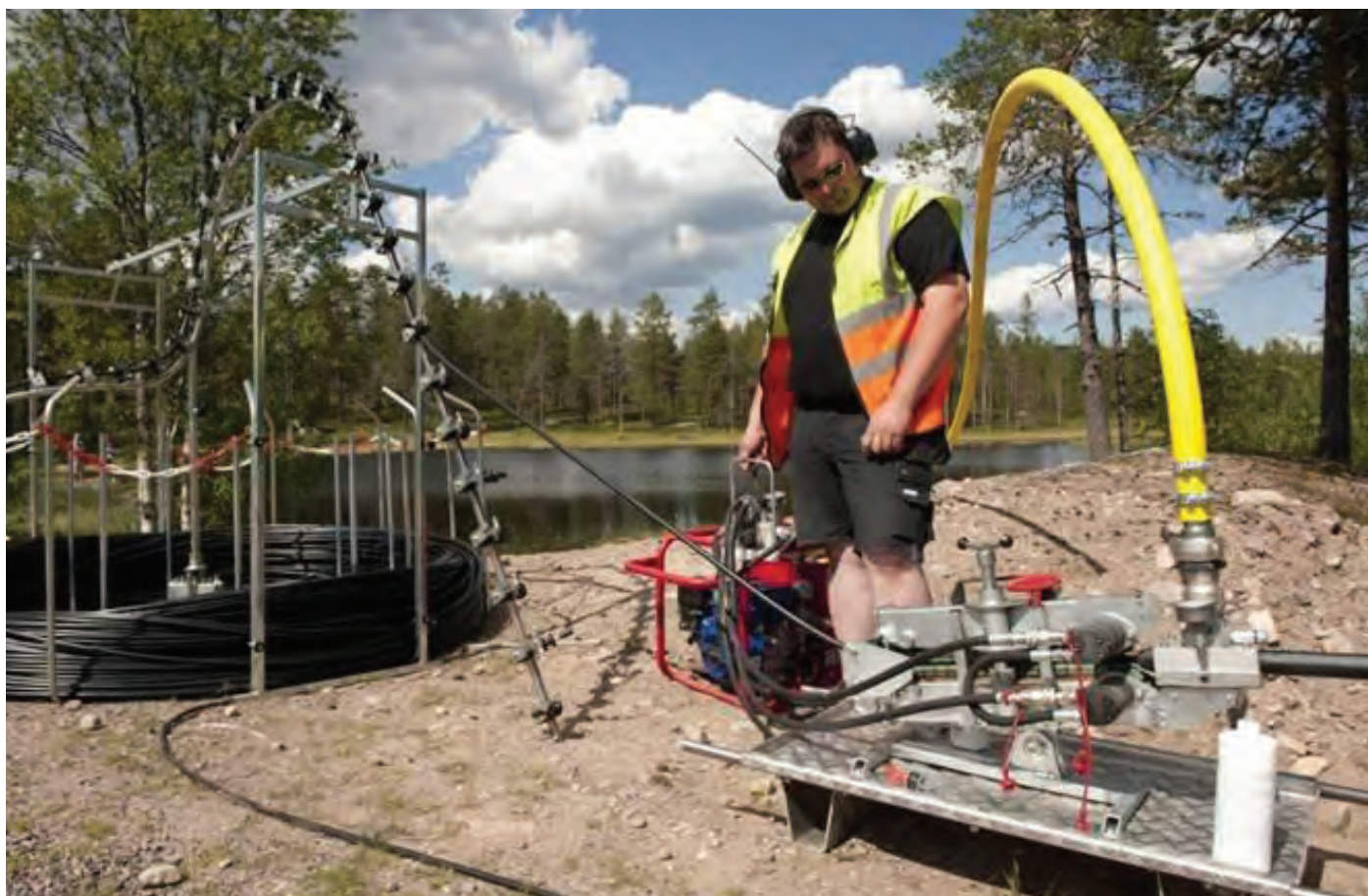
Fiberblåsing for enkel installasjon