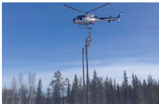
Komposittmast på vei